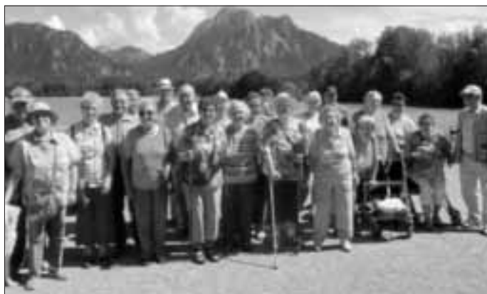
„Das Seniorencafe on Tour am Forggensee“